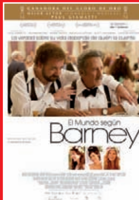
+ 7 urte