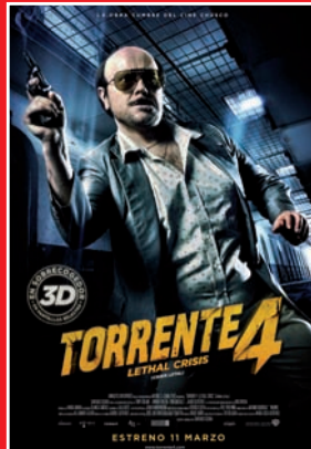
+ 12 urte