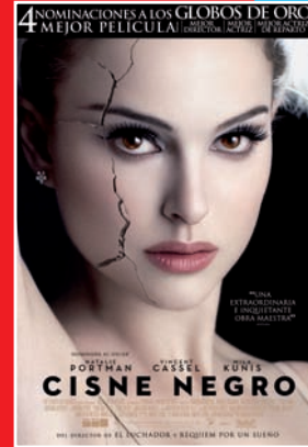
+ 12 urte