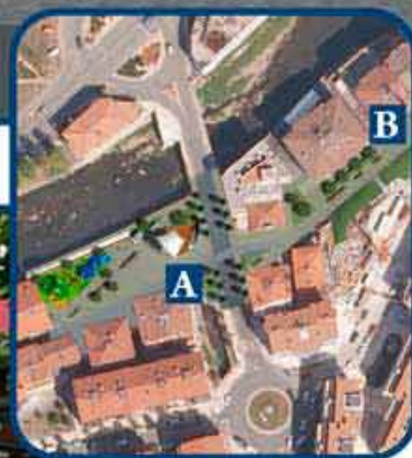
Visto desde B